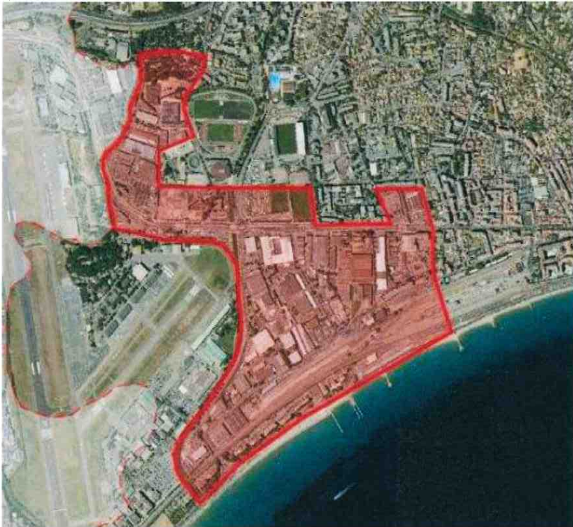
Périmètre de la zone d'aménagement différé à renouveler