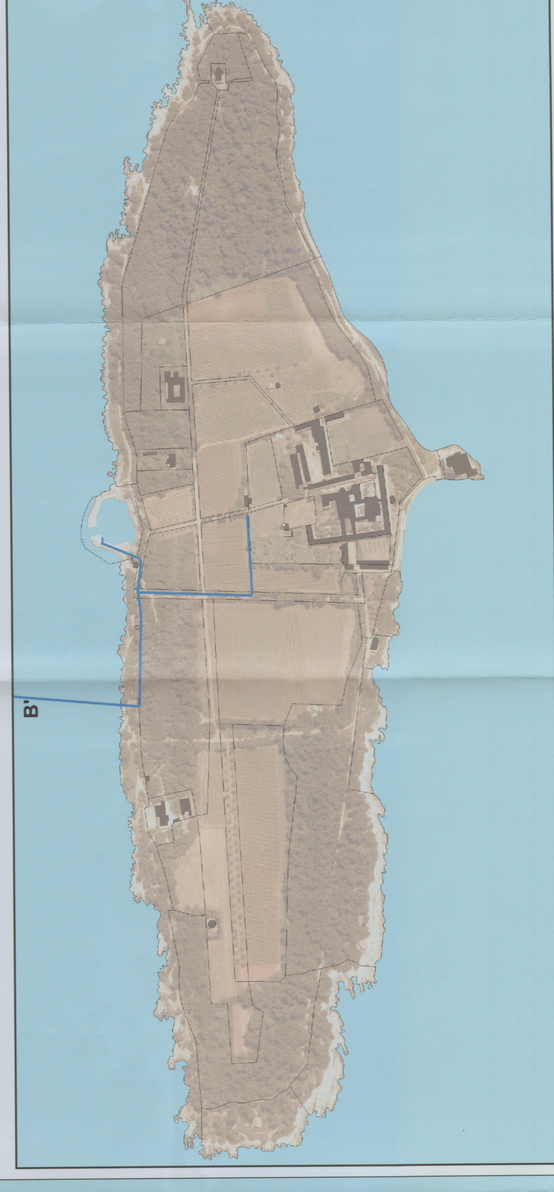
Zoom sur l'île de Saint Honorat (échelle 1/3 000 ème)