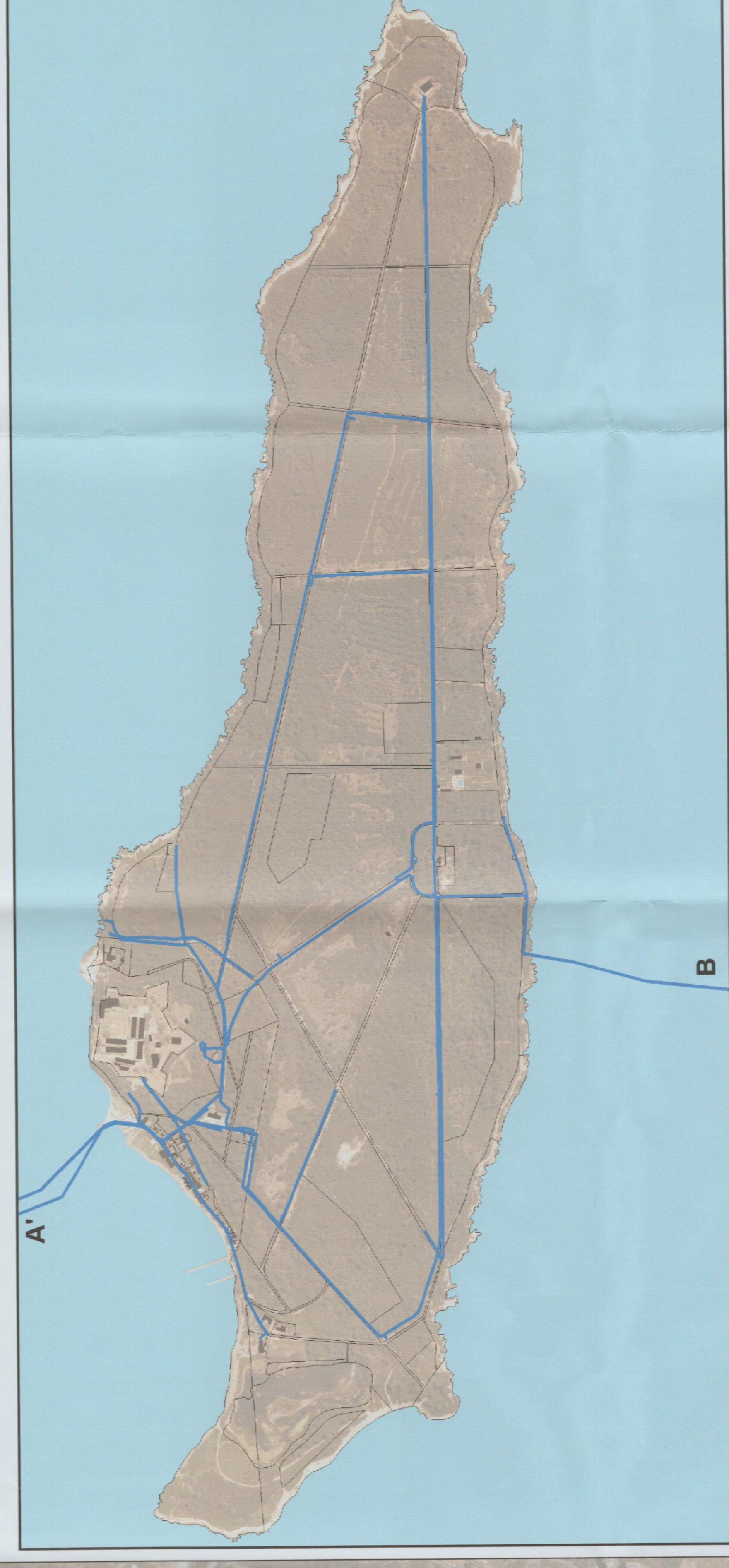
Zoom sur l'île Sainte Marguerite (échelle 1/6 500 ème)