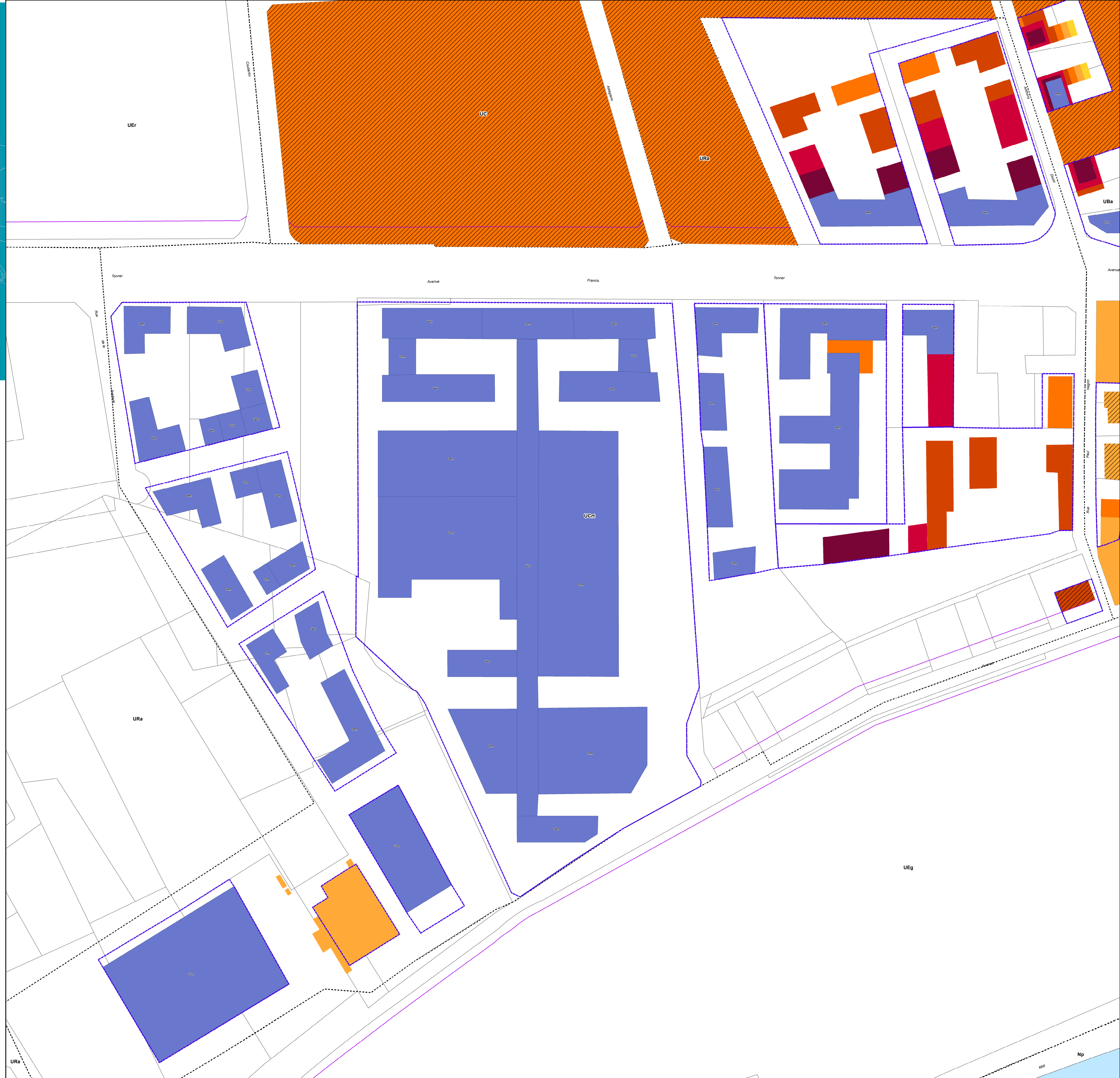
▲ Cannes la Bocca - Zone Roubine (échelle 1/750 ème)