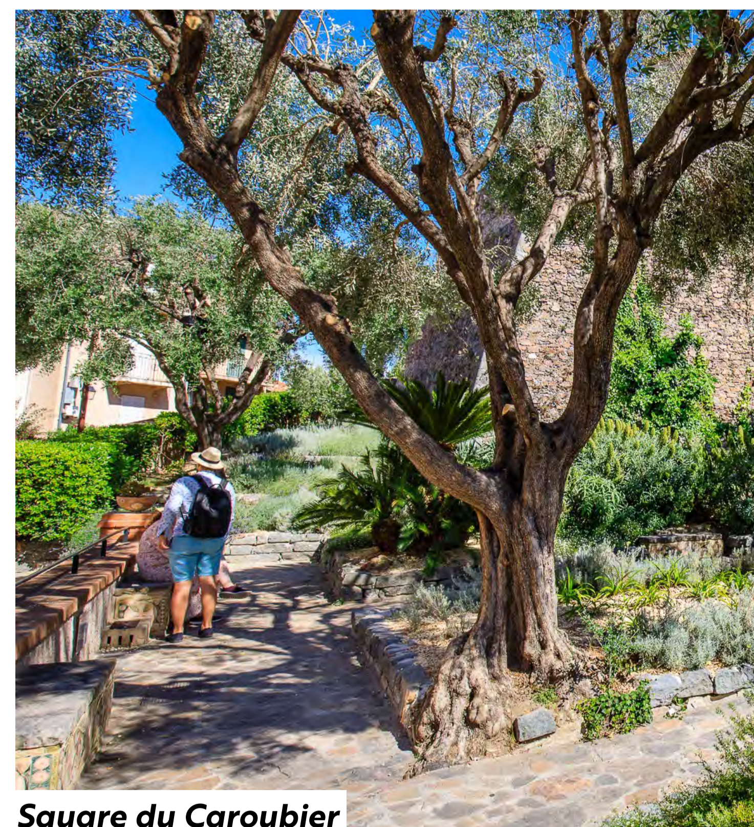
Square du Caroubier