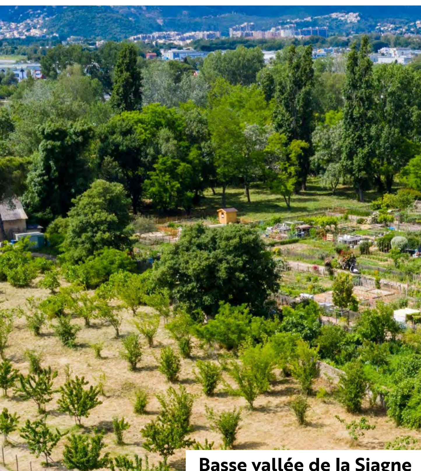
Basse vallée de la Siagne