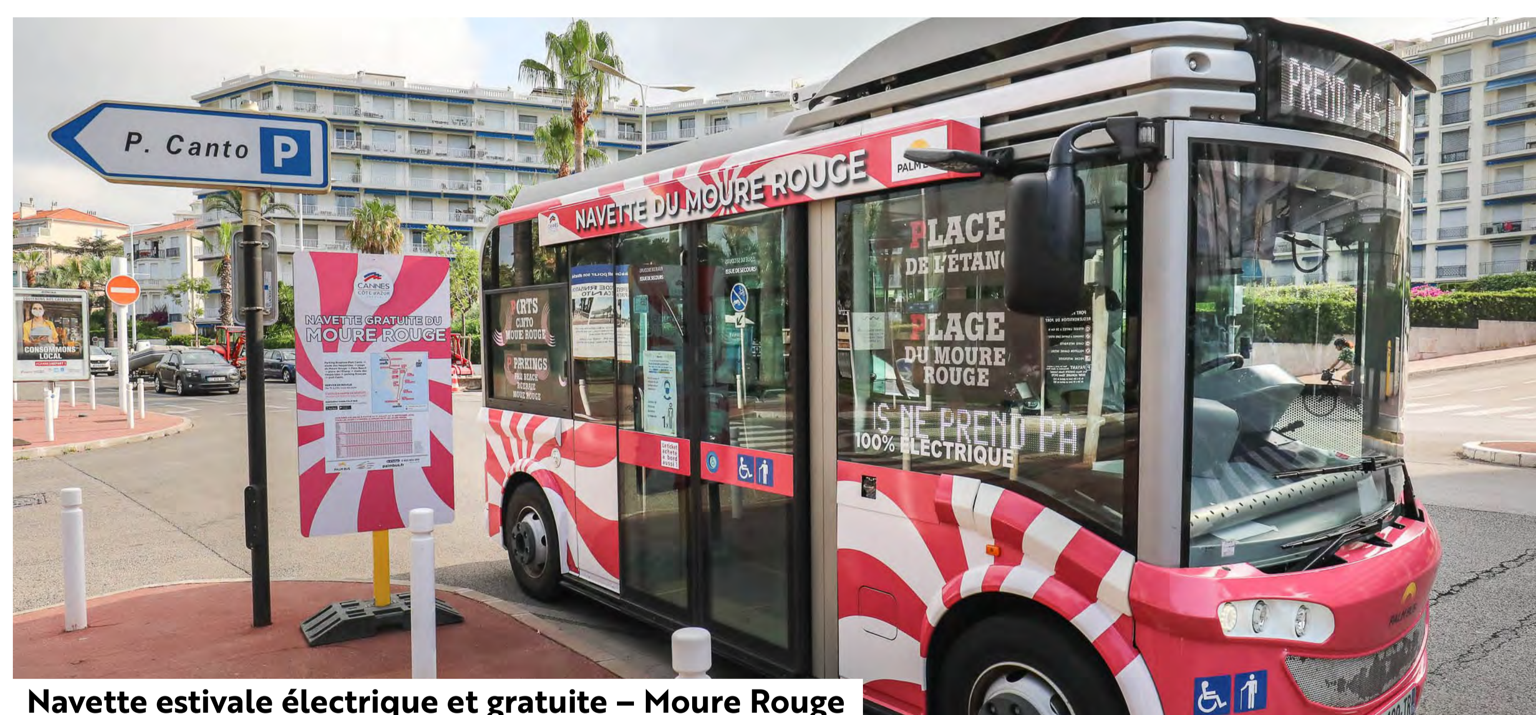
Navette estivale électrique et gratuite – Moure Rouge