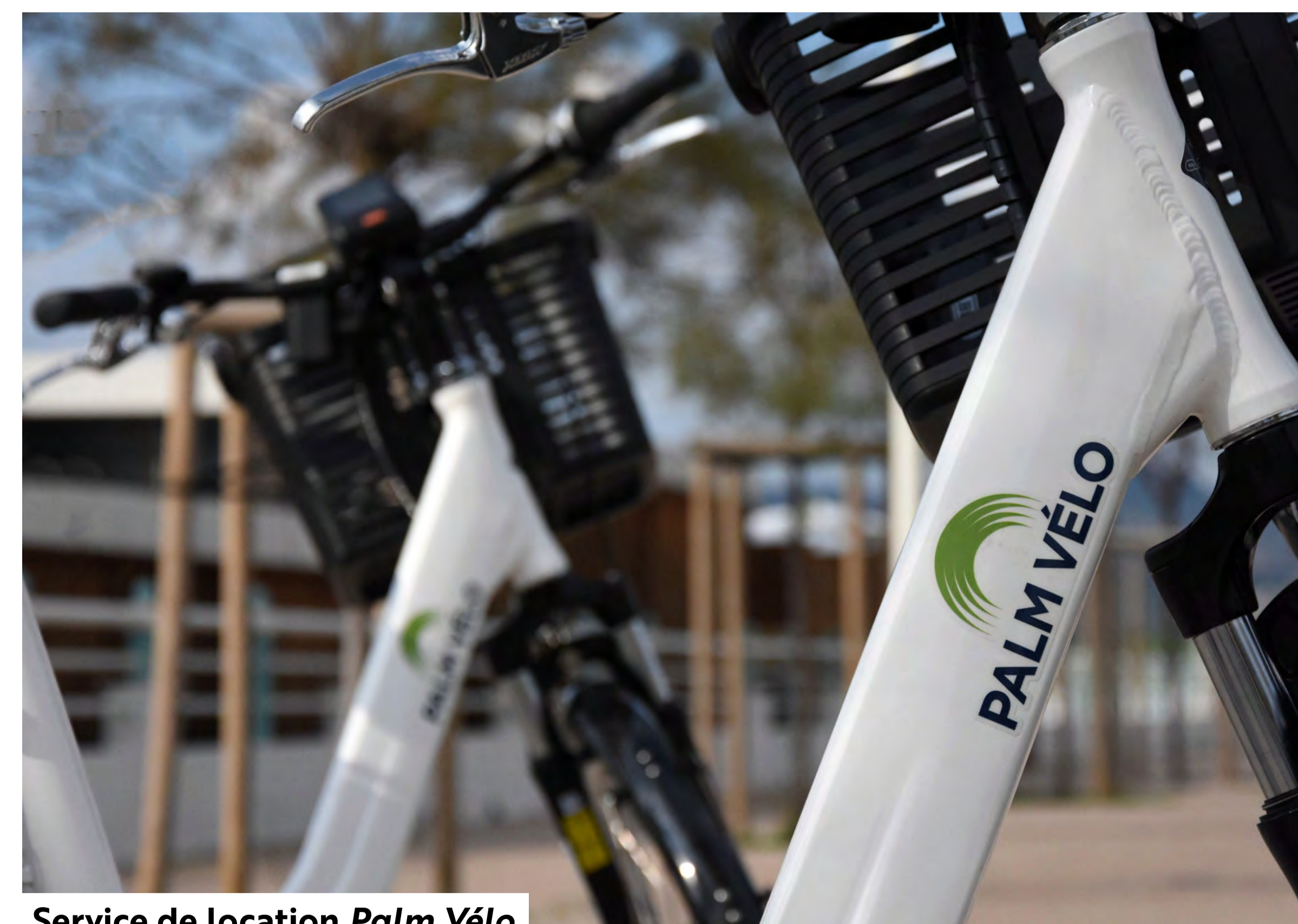
Service de location Palm Vélo