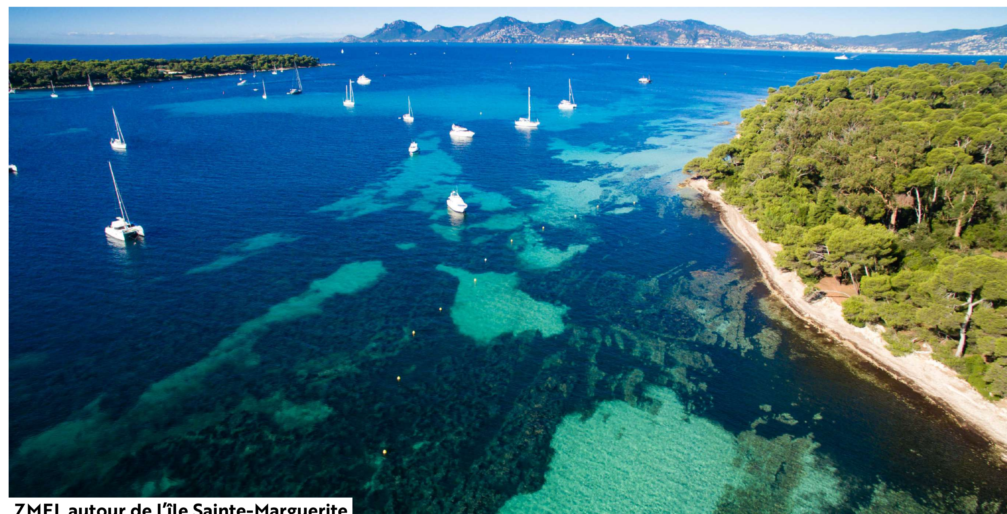
ZMEL autour de l'île Sainte-Marguerite