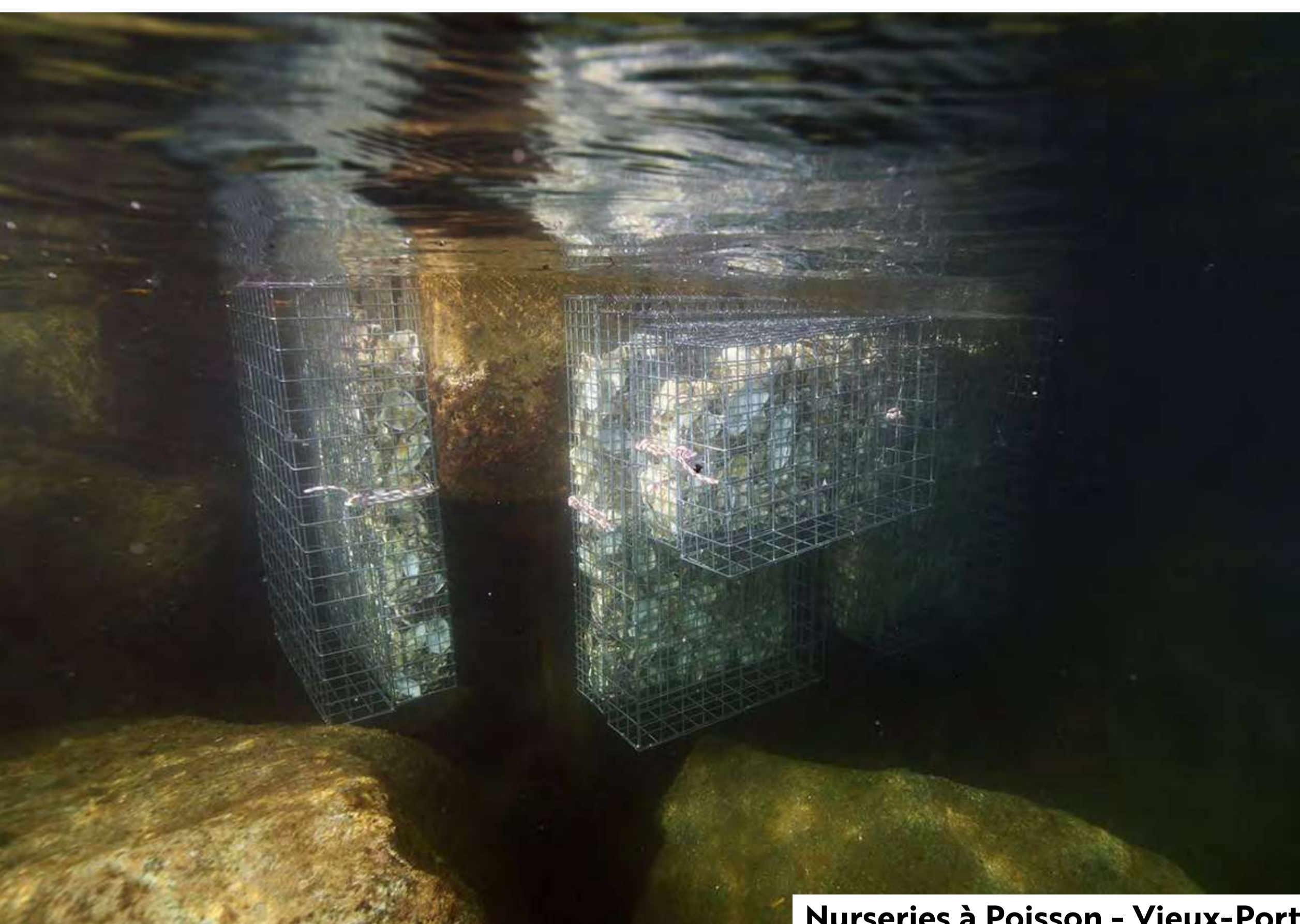
Nurseries à Poisson - Vieux-Port