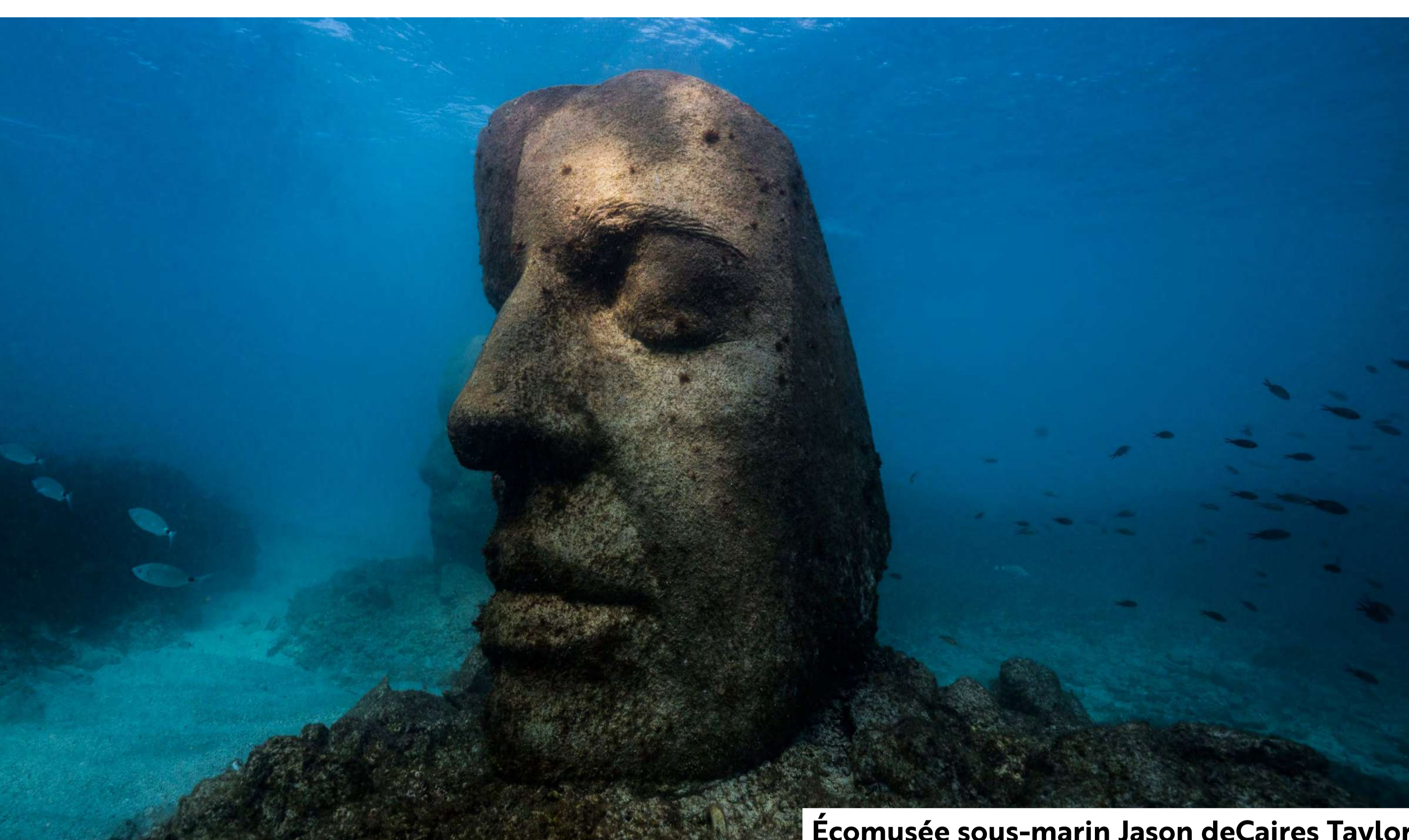
Écomusée sous-marin Jason deCaires Taylor