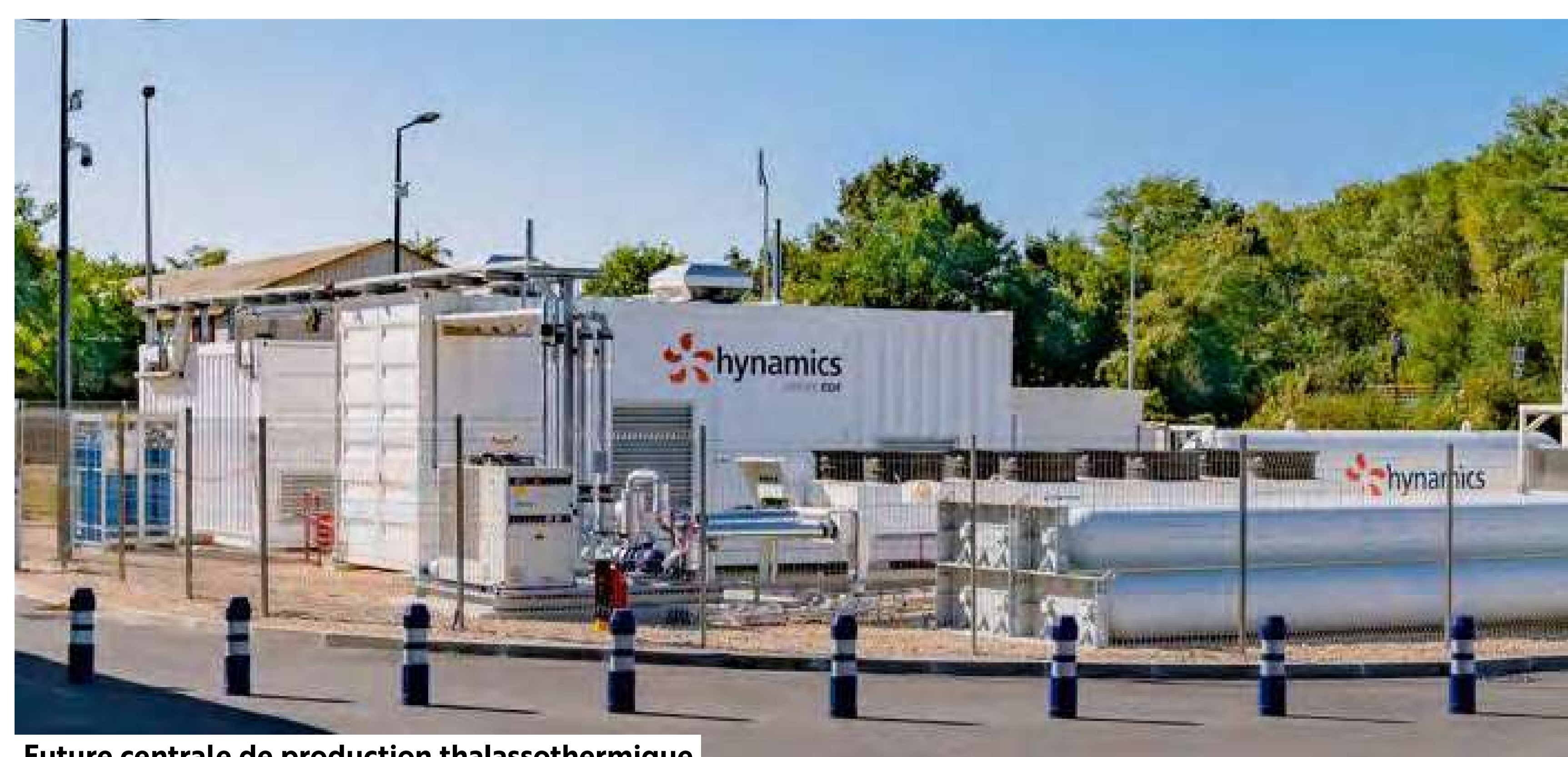
Future centrale de production thalassothermique