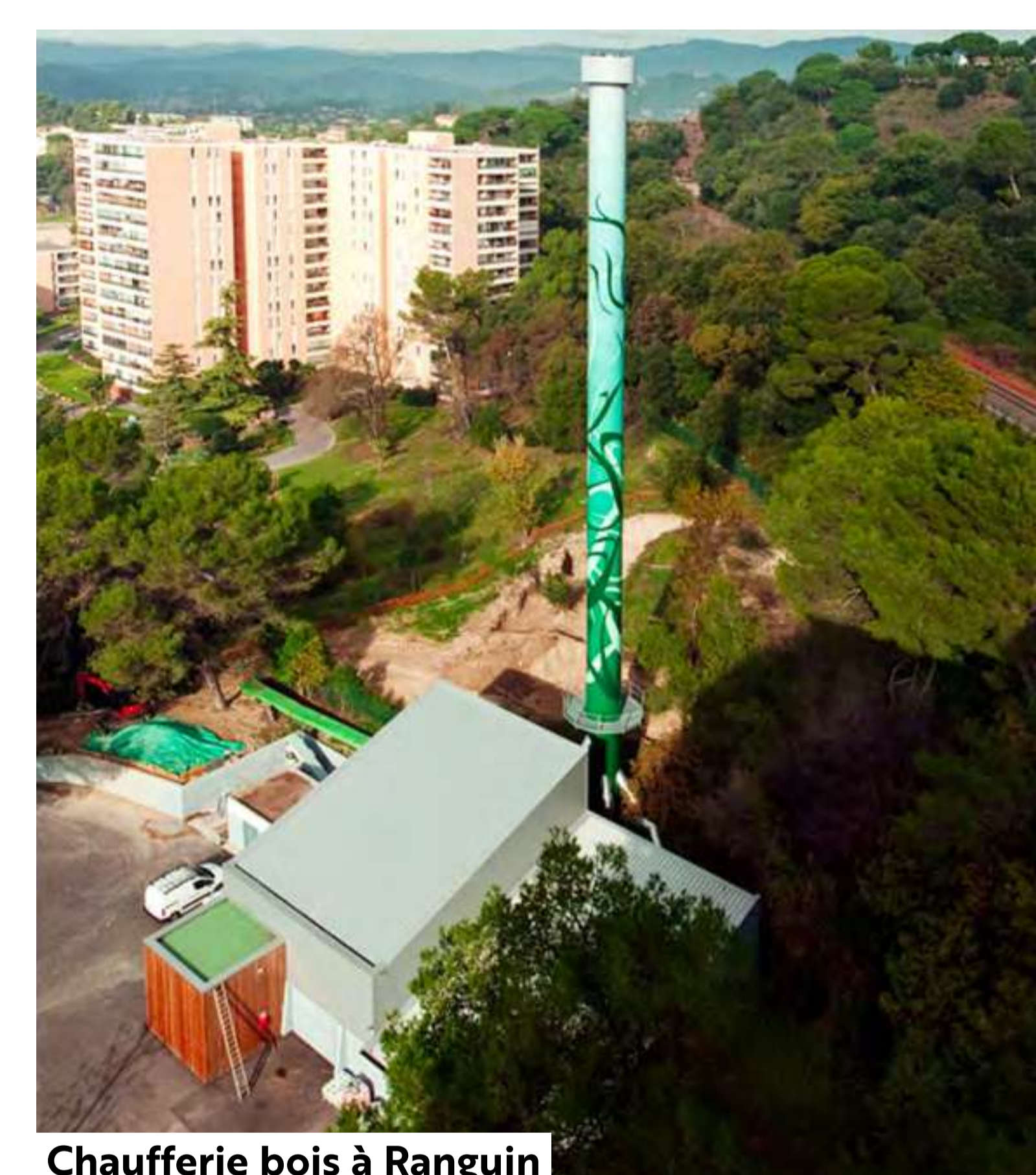
Chaufferie bois à Ranguin