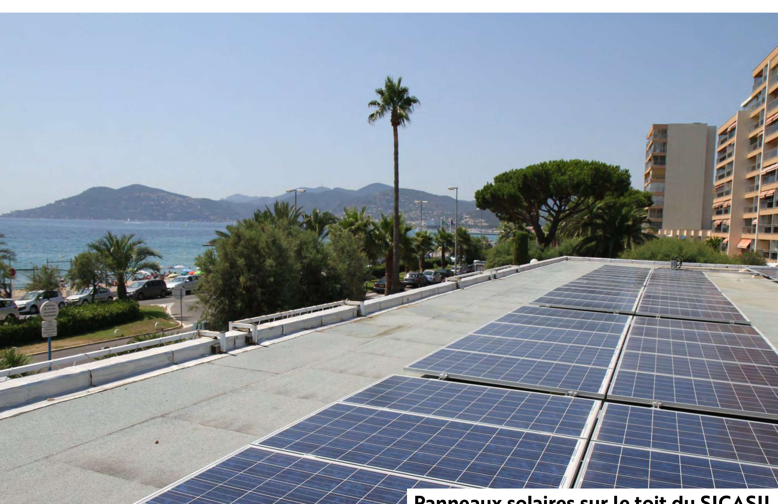
Panneaux solaires sur le toit du SICASIL