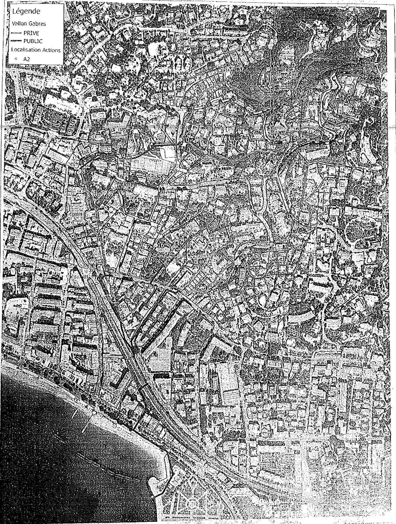
Localisation des actions pour EP- DIG d'entretien Vallon des Gabres

Révisé par : Date : 22/05/2017 Echelle : 1/1000